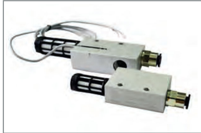
基本型真空发生器GBS

概述： 体积小巧的基本真空发生器，塑料机身，用于在高速运动下搬运不透气工件，特别适用于分散式真空发生系统。